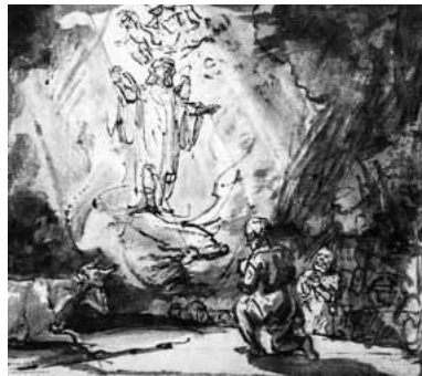
Rembrandt: Forkyndelse for hyrderne

Lige meget hvilken af historierne vi vælger, så handler den om, at der den nat i Betlehem skete noget afgørende nyt. En ny tid begyndte. Der er en tid før og en tid efter Kristus, så vigtig var den fødsel i en stald i et land langt borte for mere end 2000 år siden. Det indvarslede en ny begyndelse.