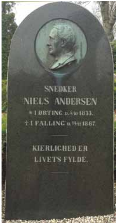
Øverst: Gravsten på Falling kirkegård Nederst: Krucifiks i Ørting Kirke