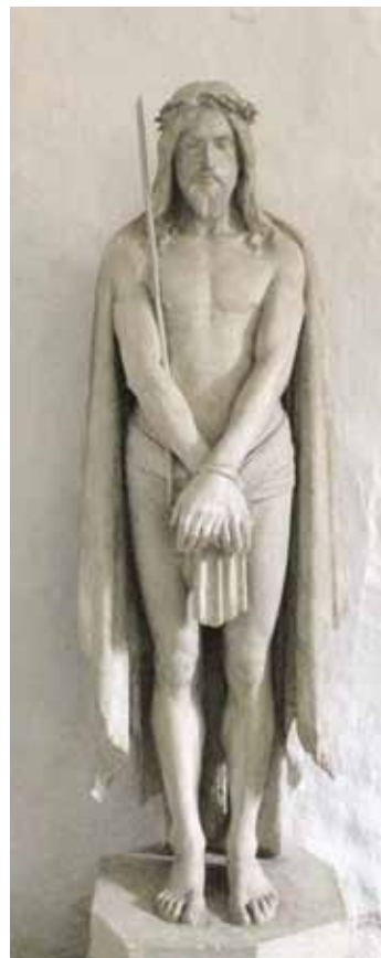
Øverst: Kristusfiguren i Falling Kirke 1893