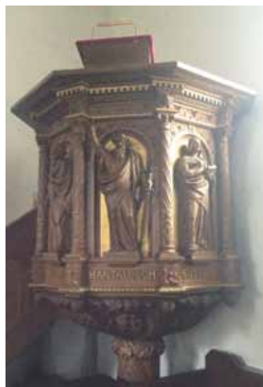
Nederst: Prædikestolen i Gylling 1911