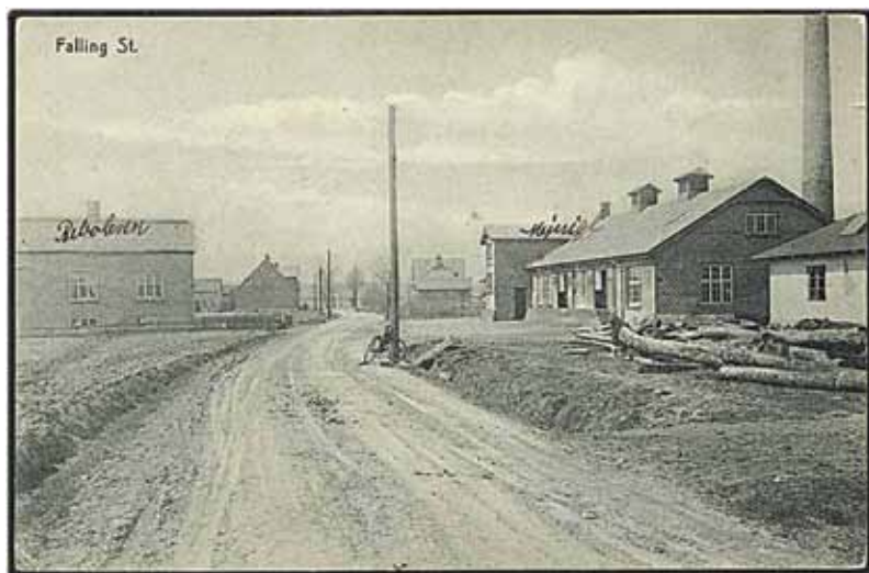
Billedet fra Falling er ca. 100 år gammelt, og altså fra før den periode, Jørgen Elbæk vil fortælle om. I midten af billedets baggrund skimtes Falling Station, og overfor ligger forsamlingshuset.

Jeg vil fortælle om dagligdag og fest, om folk og fæ, i det Falling, jeg husker fra min tidlige barndom, til jeg rejste hjemmefra i 1956. En liv, der var så anderledes end det, vi oplever og har i dag.