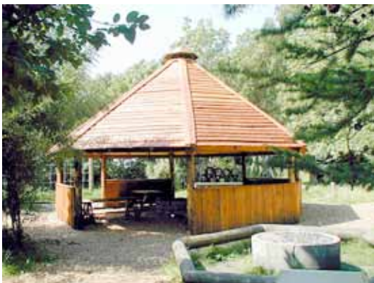
Øverste billeder: glimt fra en FDF-aften på Toften. Emnet er SAMARBEJDE. Nederst en bålhytte, som ligner den, der bliver opført i løbet af juni måned.

Børn og voksne, som har deres gang i Ørting-Falling FDF, har længe ønsket en bålhytte og shelters på Toften for at få bedre rammer om spejdernes friluftsliv - og nu ser det endelig ud til at lykkes! Men det har været en lang og sej kamp!