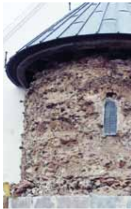
Apsis før og under reparation. Man ser murfyldet som har været urørt siden 1225.

Det viste sig at blive mere kompliceret end forventet, hvilket har medført, at det ikke kan lade sig gøre lave arbejdet færdigt før til foråret. Derfor har det været nødvendigt at opsætte plader for beskytte mod vinteren. Heldigvis havde vi gemt de plader, som blev brugt til at beskytte portalen.