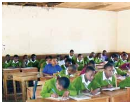
Frederikkens engelsklasse. Der er stor aldersspredning, og kun læreren har bøger

ende, som tjente til deres studier ved at undervise i en periode.