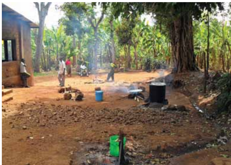
Skolens elever arbejder også med praktiske opgaver. Her er frokosten ved at være klar i skolekøkkenet.